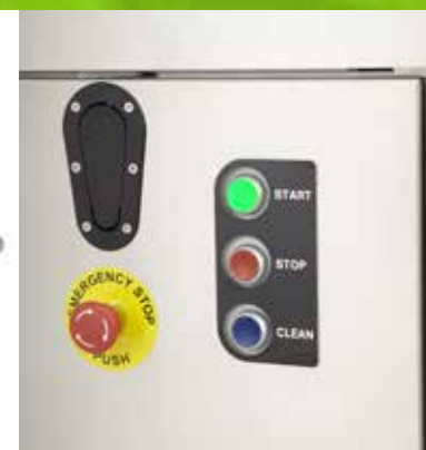
Vizuální ovládací panel